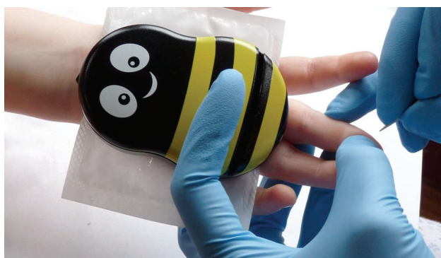
FIGURA 2. DISPOSITIVO BUZZY®

Se aplica proximal al sitio de punción, en este caso lanceta para toma de muestra capilar. El efecto analgésico se obtiene al combinar frío y vibración emitida por el dispositivo.